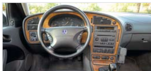
Tipikus Saab: igényes fabetét a műszerfalon, gyújtáskulcs a kézifékkar mellett, elektromos ablakemelők pedig a középkonzolon

A Kia márka hazánkban még kevésbé (el)ismert, a Magentis mo-