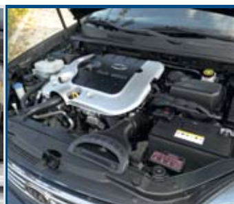
Kisebb lökettérfogata ellenére plusz 20 lóerőt és 25 Nm-nyi nyomatékot kínál az 1,41 tonnás Kia