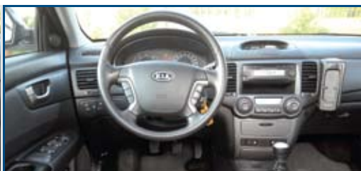
Könnyen áttekinthető a Kia belseje, a rádió kormánykerékbe integrált billentyűkkel is vezérelhető. Több a rekesz, mint a svédben

dellre ez fokozottan igaz. Pedig igenis hozza azokat a méret- és felszereltségi elvárásokat, melyeket az igazi utazólimuzinokkal szemben támasztanak. A 2005-ös modellfrissítés utáni változatok formája európai szemmel is elfogadható, a kivitelezés minősége dicséretes, az utastér tágas, a futómű hangolása pedig amerikaián lágy. Kényelem és luxus, ezt kínálja a Magentis, mellyel ráadásul minimális szervizgondok akadnak. A kormány-