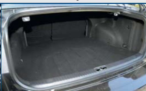
Jókora a Magentis hátsója is (495 l), az ülések a csomagterben lévő karokkal hajthatók le

gyártott 9-5-ösöket – limuzint és kombit egyaránt – például elsőtengely-problémák miatt rendelték szervizbe. A Brink típusú vonóhoroggal felszerelt darabok fejrészénél lévő reteszelő rendszer kioldhat, a 15-ös felnikkel felszerelt példányoknál pedig a kerécsavar törése fordulhat elő. A 2.0, 2.3 és 3.0 V6-os aggregátoknál a gyújtáspanel átéghet, az 1.9 TiD-knél pedig a szívárgó üzemanyagcsöveket módosították. A visszahívási akciókon végrehajtott korrekciókra mindenképpen kérdezzünk rá egy szakszervizben! Keresett alkatrészek a fényszórótörő motorok, a csomagterzárok és az első lámpaburák, ködlámpák. Utóbbiak anyaga nem különösebben masszív,