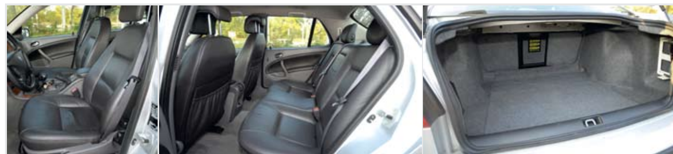
Igényes a bőrkárpit, de a műanyagok kemények