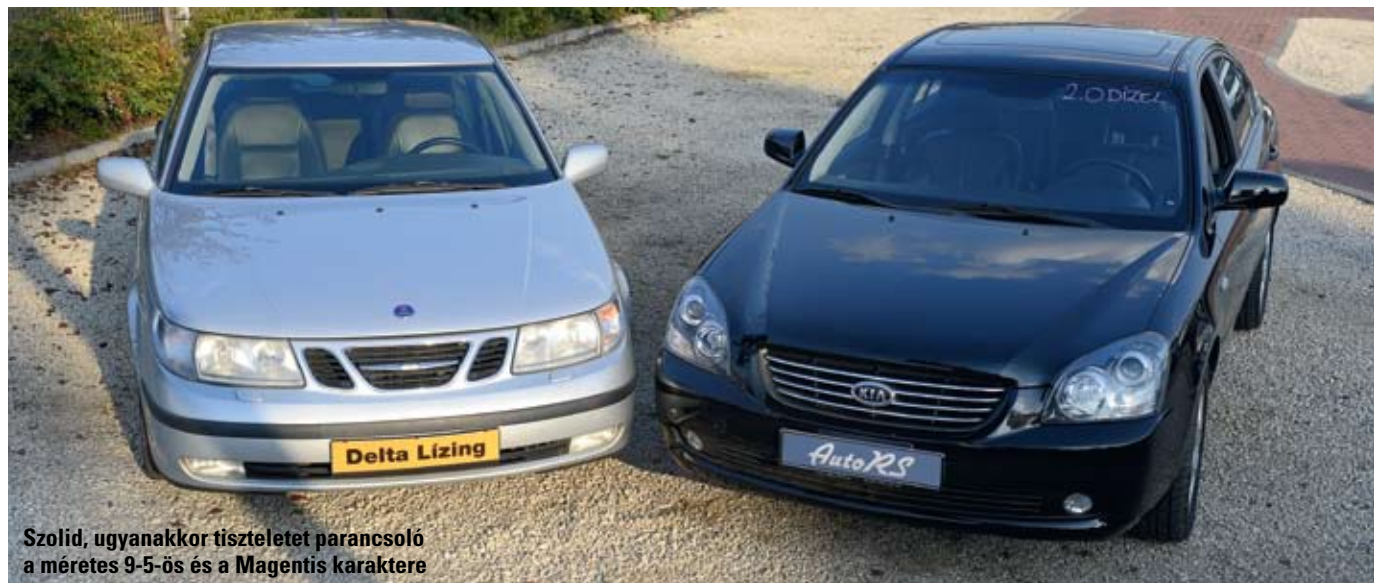
Szolid, ugyanakkor tiszteletet parancsoló a méretes 9-5-ös és a Magentis karaktere

Elegáns limuzinok gazdaságos dízelmotorral. A Kia Magentis és a Saab 9-5-ös ezzel együtt kategóriájuk elfeledett és jelentős értékvesztésű típusai közé tartozik.