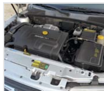
Jelentős, 1600 kilós önsúlya miatt eleve iszákosabb a szerényebb teljesítményű (120 LE) Saab, mint a koreai rivális