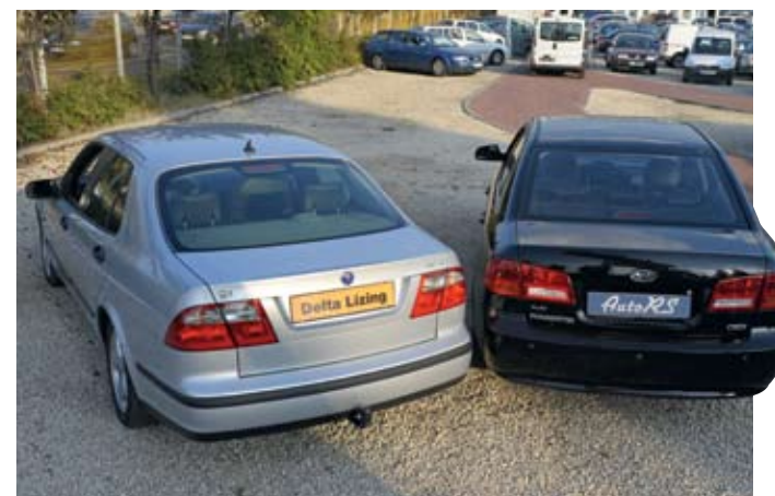
A Kiában tolatóradar segíti a parkolást, mondjuk a Saab vonóhorga is jól jöhet bizonyos esetekben...